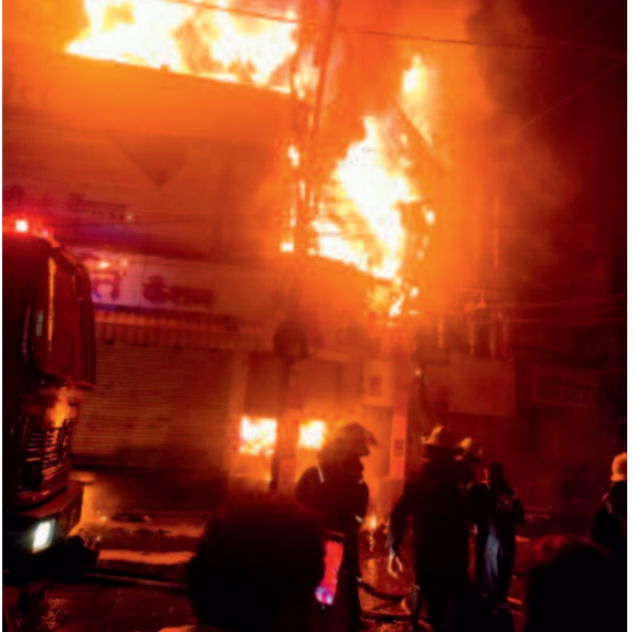
उलझी बिजली तारों का अंबार, बिजली विभाग में मेटेनेस के जल पर हो रही खानापूर्ति