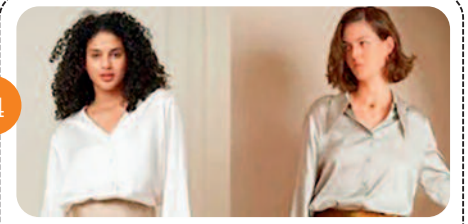
चलन में हैं रिलफ स्कर्ट, स्टाइलिश...